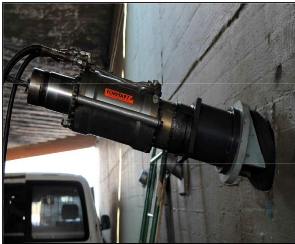
Tesado con equipo multifilar