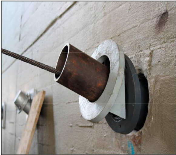
Tubo de clavado y placa de apoyo con grados