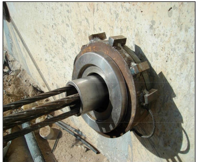
Placa de centraje gato multifilar