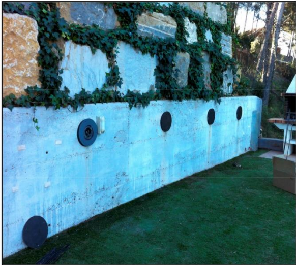
Vista general muro tesado con Anclaje Embutido