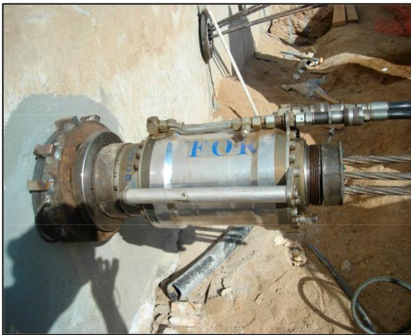
Fin tesado tendón