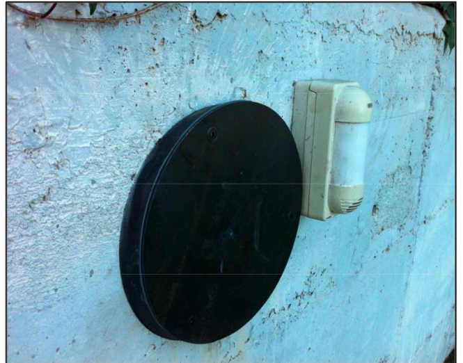
Detalle anclaje embutido finalizado