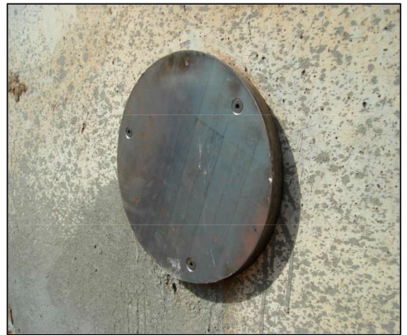
Resultado final Anclaje Embutido