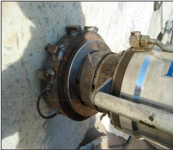
Gato posicionado para el tesado