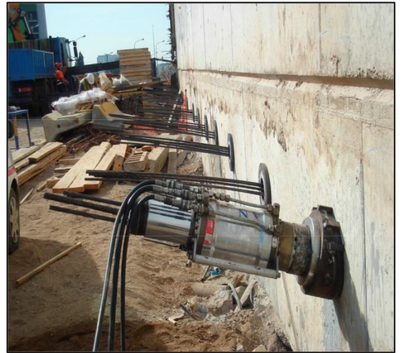
Tesado tendón 5/0,6