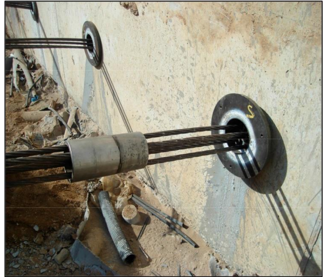
Preparación tubo de clavado