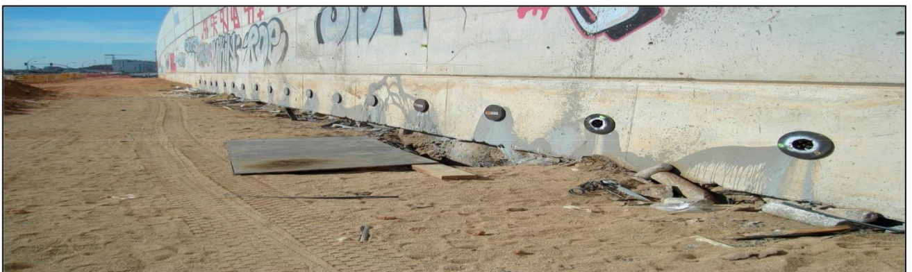
Vista general muro anclado con Anclaje Embutido