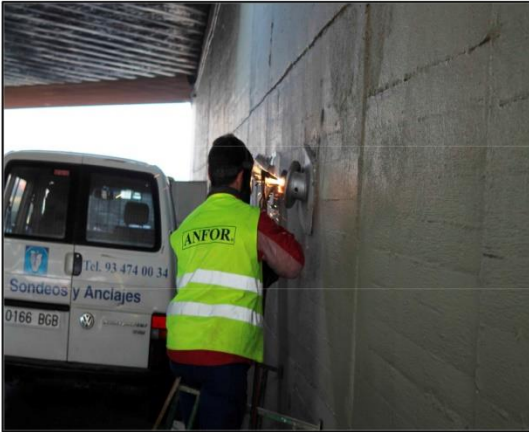
Cortando anclaje existente