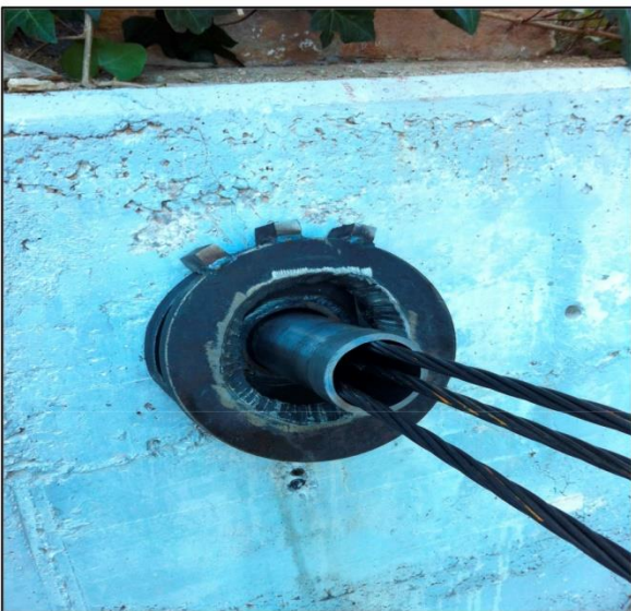
Placa con grados y tubo de clavado