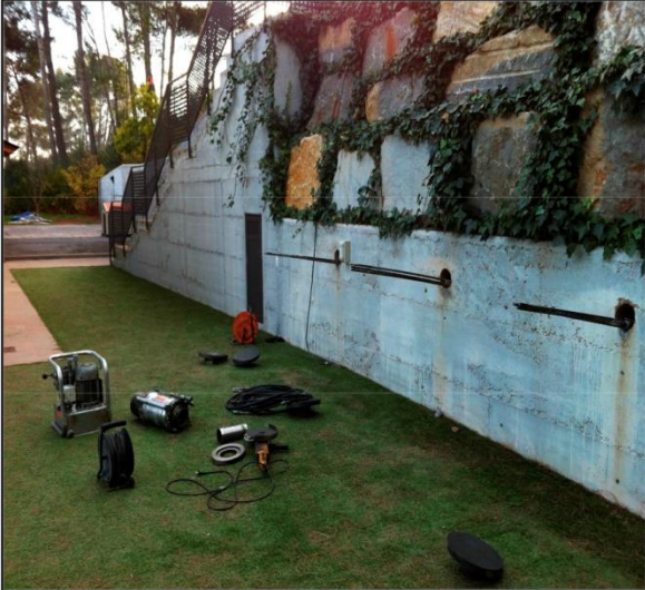
Vista general muro anclado