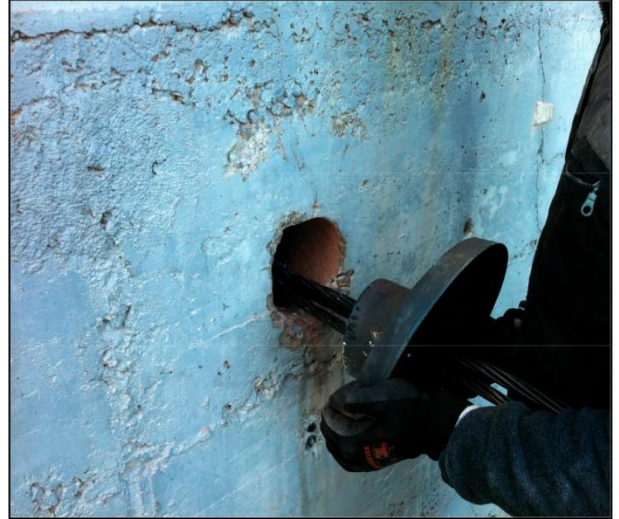
Colocación anclaje embutido 3/0,6