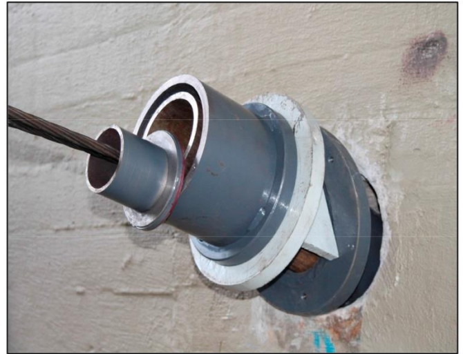
Apoyo centrador para gato multifilar