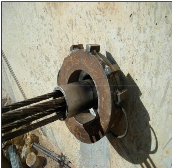
Colocación apoyo con grados