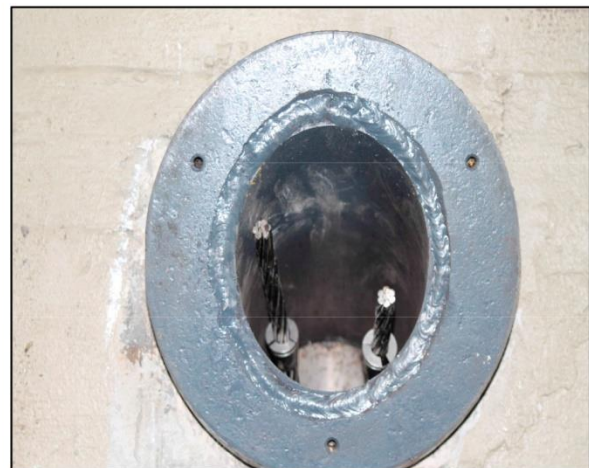
Vista torones con cuñas colocadas