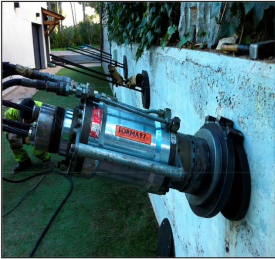
Tesado tendón 3/0,6