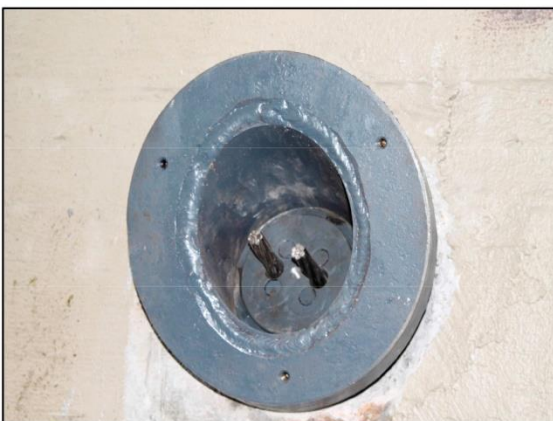
Colocación placa clavado