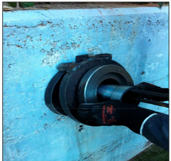
Apoyo para gato multifilar 1090kN