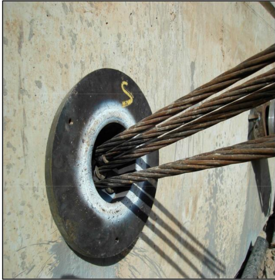
Anclaje Embutido con cuñas colocadas